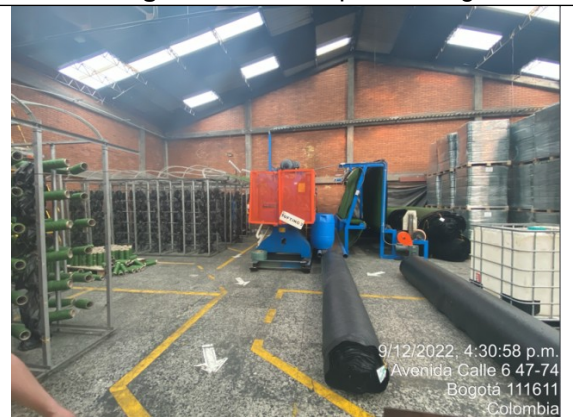
Fotografía No. 8 Maquina tufting 3