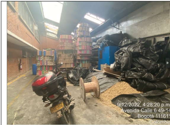
Fotografía No 3. Centro de acopio