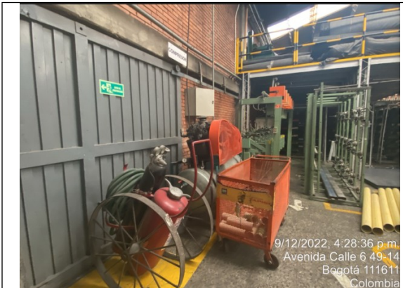
Fotografía No. 5 Compresor de aire