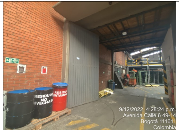
Fotografía No 4. Ingreso de la materia prima