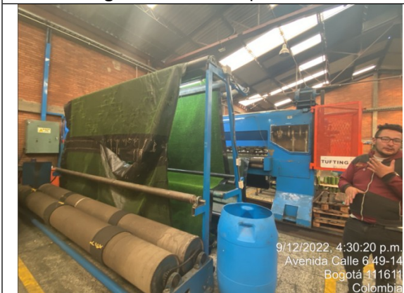
Fotografía No. 7 Maquina tufting 2