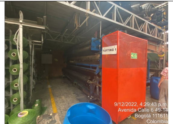
Fotografía No. 6 Maquina tufting 1