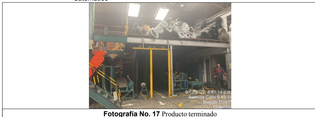
Fotografía No. 17 Producto terminado